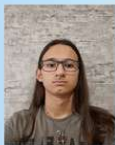
Подготовил Вергазов Ильдар, гр. 2108 МН-1