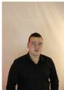
Подготовил Заварзин Денис, гр. 2109 МН-1